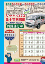
バス赤十字病院線