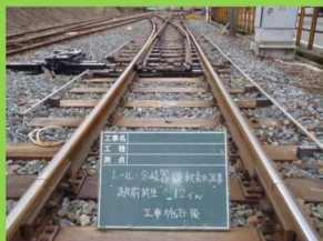
レールの交換工事