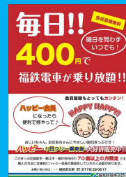
お得なきっぷの発売